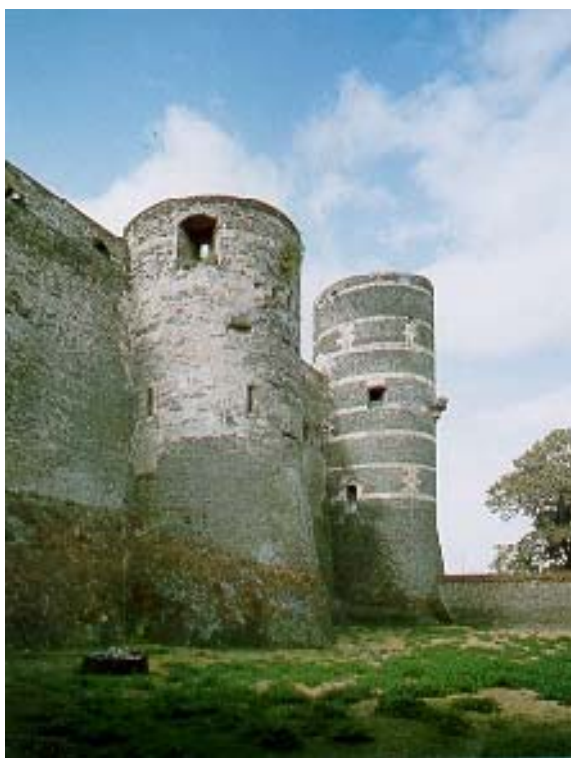
Angers : Vue extérieure de l'enceinte

Dans la seconde moitié du XII e siècle, la Touraine et l'Anjou sont aux mains des Plantagenêts, comme une bonne partie de la France. La reconquête entreprise par Philippe Auguste s'achève en 1214 par la victoire de Bouvines et la renonciation définitive de Jean Sans terre à ses possessions ligériennes. Pour marquer la présence royale, plusieurs châteaux sont alors reconstruits, tel Chinon qui devait voir remodelées peu à peu ses hautes murailles de calcaire. De même à Angers, capitale d'un territoire fraîchement acquis, le jeune saint Louis commence à élever peu après 1226 l'immense enceinte rythmée par dix-sept tours bicolores avant de la remettre vingt ans plus tard à son frère Charles, duc d'Anjou, futur conquérant du royaume de Naples.