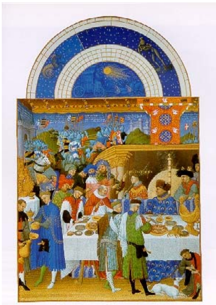
Très riches heures du duc de Berry

A la fin du XIV e siècle, époque de répit entre les deux phases de la guerre de Cent Ans, ces princes des fleurs de lis font sortir de terre une nouvelle race de châteaux, demeures fortifiées de grand luxe aux sculptures débordant de leurs chemins de ronde. Avec leurs silhouettes étirées, les plombs dorés de leurs faîtages, leurs lucarnes effilées aux gâbles fleuronnés, ces flamboyants châteaux nourris de poésie chevaleresque sont devenus — enluminures des Très riches heures du duc de Berry aidant — les emblèmes universels d'un Moyen Age de contes de fées.