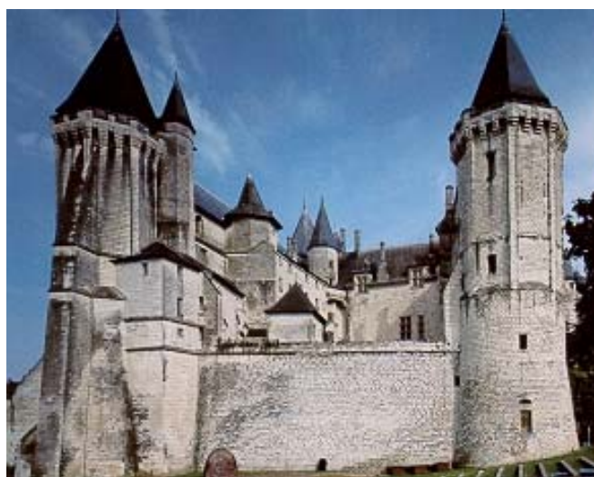
le château de Saumur