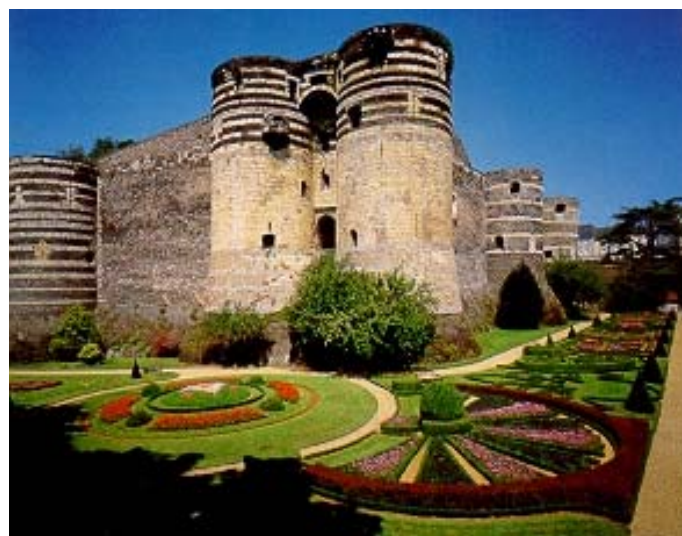
Le château d'Angers

Dès le milieu du XIII e siècle en effet, le pouvoir capétien se sent assez fort pour faire supporter au domaine royal des aliénations familiales. Mais c'est au siècle suivant, sous la dynastie des Valois, que les apanages des fils cadets du roi allaient se multiplier, avec les duchés de Berry et d'Anjou accordés aux frères de Charles V, puis celui d'Orléans donné à son second fils.